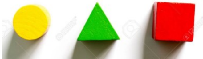
LE ROND LE TRIANGLE LE CARRÉ

En classe, nous travaillons sur les formes suivantes :